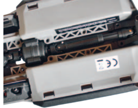
Chassis von unten mit geöffnetem Antriebsstrang. Auch die Zweiteilung des Aufbaus mit seitlichen Akkuschächten ist hier schön zu sehen.

Nein, der „große“ Summit bleibt weiterhin ein Auto für den besonderen Anspruch. Der „Kleine“ sieht ihm zwar sehr ähnlich, ist aber ein Auto, das einfach durch schiere Power und Fahrspaß statt durch technische Gags überzeugen will. Wer wirklich gute, stabile und alltagstaugliche Technik im Maßstab 1:16 für den Spaß vor der Haustür sucht, oder schlicht keine Lust hat, sich mit langer Einstellarbeit am Fahrwerk zu beschäftigen, der ist mit dem Summit bestens bedient. Bereits aus der Schachtel mehr als ausreichend motorisiert ging auch bei der Brachialleistung mit 4S-LiPo nichts kaputt.