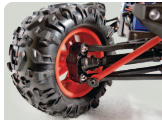
Die Pivot-Ball-Aufhängung der Vorderachse und eine der Kardanwellen. Reifen und Felgen sind fertig verklebt.

weide des Autos arbeitet, wird feststellen, dass es nicht besonders servicefreundlich aufgebaut ist. Wohl um Staub und Wasser möglichst aus allen beweglichen Komponenten fernzuhalten, wurde ein ziemlich verschachtelter Aufbau gewählt. Die Serviceintervalle dürften sich dadurch zwar verlängern, aber im Fall der Fälle ist tief greifende Demontage erforderlich, die aufgrund der kleinen Bauteile recht fummelig sein kann.