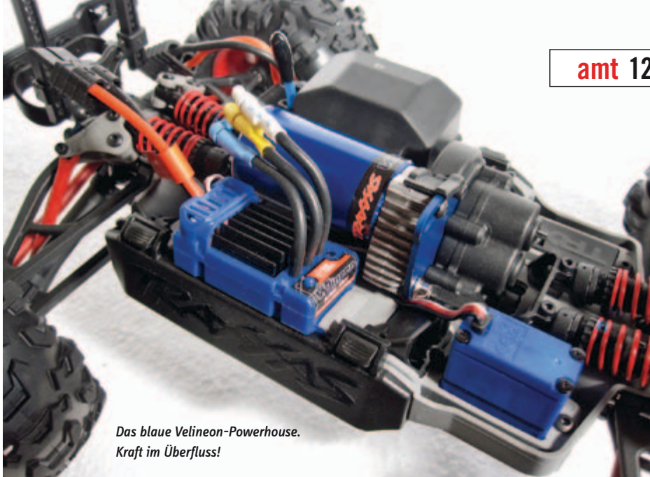
Das blaue Velineon-Powerhouse. Kraft im Überfluss!