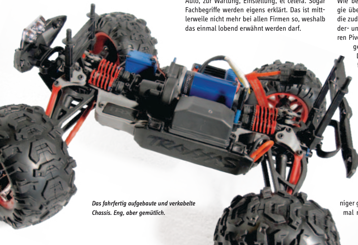
Das fahrfertig aufgebaute und verkabelte Chassis. Eng, aber gemütlich.

Es gibt allerdings auch etwas, das mir weniger gefallen hat. Wer sich, so wie ich, erst einmal mit dem Inbusschlüssel durch die Einge-