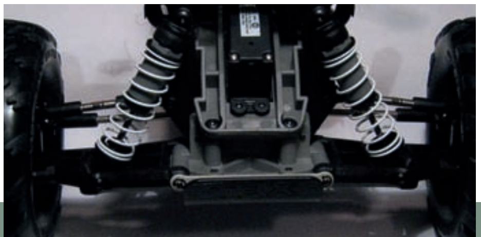
Die Vorderachse mit großvolumigen und feinfühlig arbeitenden Dämpfern