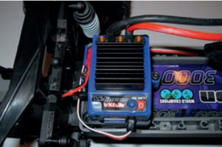
Der Regler ist mit Goldkontaktbuchsen versehen, was Ein- und Ausbau erleichtert. Der kleine rote Stecker dient als Stromversorgung für einen optionalen Lüfter