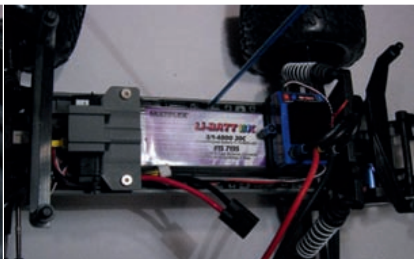
Nach der „Operation“ passt der 3-S-LiPo-Pack wie eingegossen in den Akkuschacht