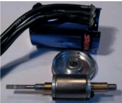
Der Motor kann zur Reinigung leicht zerlegt werden. Die Motorwelle wurde zur Ritzelaufnahme auf die üblichen 3,17 mm abgedreht

Meine zweite Reaktion war dann etwas gedämpft: ein Almost-ready-to-run-Modell. Also fix und fertig aufgebaut; lediglich passende Akkus und ein Ladegerät fehlen zur Vollausstattung. Diese Modelle wurden in den letzten Jahren zwar immer besser, einen altgedienten Bastler reißen sie aber in der Regel nicht zu Begeisterungstürmen hin.