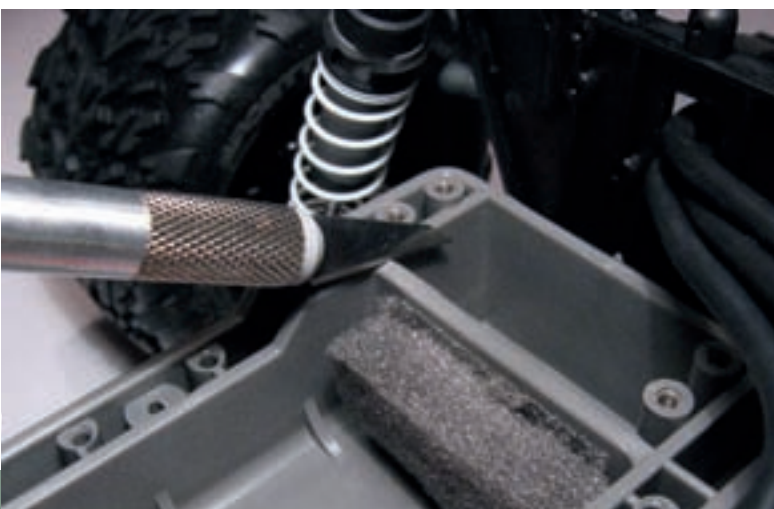
Diese Versteifung muss entfernt werden, wenn man siebenzellige NiXX-Akkus oder LiPo-Zellen einsetzen will

„Brushless“ heißt das Zauberwort für Leistung. Das weiß man auch im Hause Traxxas und pflanzte dem Stampede so ein heißes Aggregat ein. 65 Meilen pro Stunde soll der Monstertruck rennen und somit schneller sein als die amerikanische Polizei erlaubt.