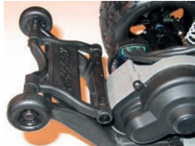
Unverzichtbar bei derart brachialer Leistung ist eine stabile Wheeliebar

Punkt zwei wird ebenfalls gut erfüllt, wenn auch mit einem Minuspunkt. Das Modell lässt sich, zum Beispiel zur Reinigung, komplett zerlegen. Die Passgenauigkeit aller Teile ist hervorragend und die durchgängige Verwendung metrischer Gewinde erleichtert den Ersatz verloreener oder abgenutzter Schrauben. Allerdings (und das ist der Minuspunkt) macht es die beigefügte deutsche Anleitung in „Kopiererquali-