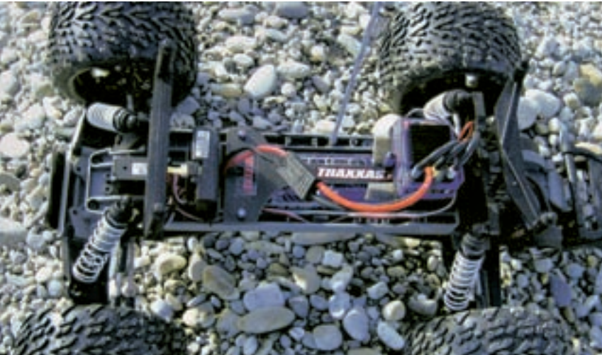
Der Empfänger sitzt vorne im Chassis und ist möglichst weit vom Regler und Motor entfernt. Das sorgt für eine gute Störsicherheit der RC-Anlage

der Karosseriehalterung hat messerscharfe Kanten. Diese Kanten mit etwas Schleifpapier oder einem Bastelmesser brechen, das verhindert wirksam wunde Finger.