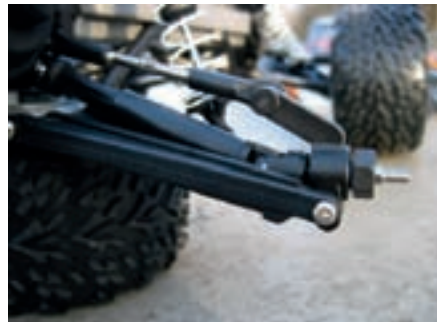
Die Kraftübertragung zu den Hinterrädern übernehmen teleskopierbare Kardanwellen

In Abwandlung eines bekannten Werbespruchs könnte man auch sagen: „Traxxas verleiht Flüüügel“. War der Stampede bis dato schon ein flotter Renner, war er jetzt wirklich ein wildes Biest. Es ist überhaupt kein Problem, fünfzig oder hundert Meter am Stück auf den Hin-