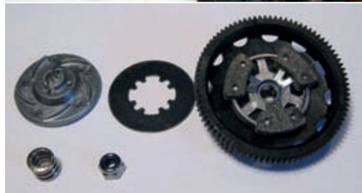
oben: Ein einstellbarer Slipper schützt das Getriebe vor Drehmomentspitzen unten: Der zerlegte Slipper. Man beachte die „Kupplungsbacken“ und (im Bild links) die hintere Aufnahme der Druckplatte mit integriertem Kühlgebläse

einmal kurz an die Box, um den Slipper etwas härter zu stellen. Dank der dafür vorgesehenen Öffnung in der Getriebeabdeckung ist das eine Sache von zehn Sekunden.